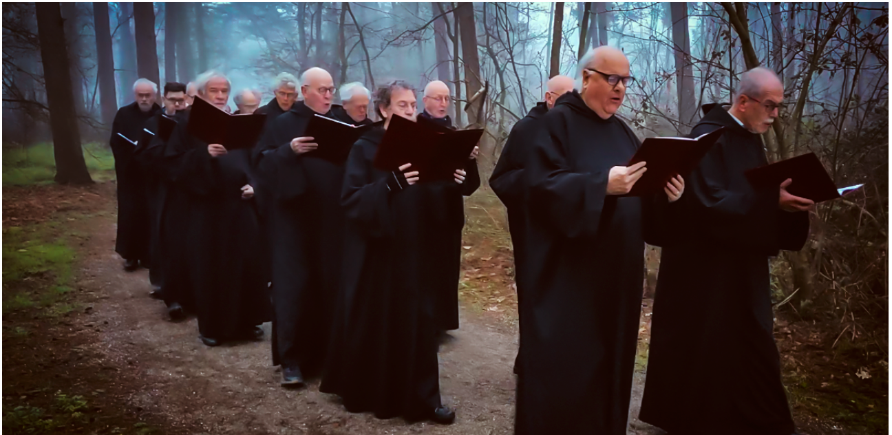
Paaszaterdag, processie in de vroege ochtend te Sint Walrick